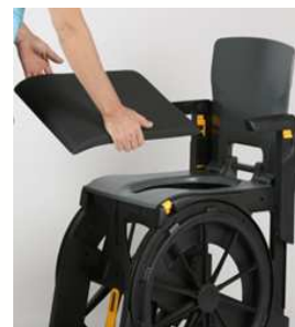
Assise de siège

Le fauteuil WheelAble de Seatara peut être équipé d'un bassin spécial permettant de le convertir en toilettes mobiles accessibles.