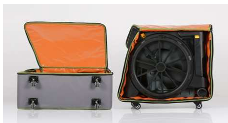
Sac de rangement